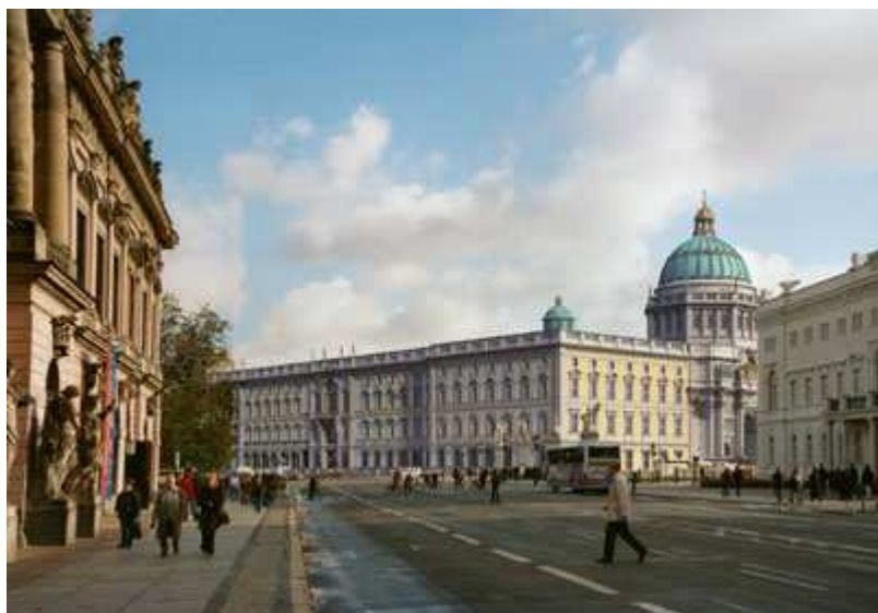
Vue prise d'Unten den Linden sur le château de 2015. CAD-Rekonstruktion: Eldaco Rostock