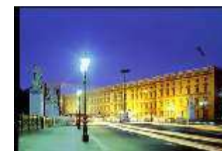
Simulation du château en 1993/1994

Ouvert à chacun, il devient un lieu de rencontre de tous les habitants et des invités de la ville de Berlin.